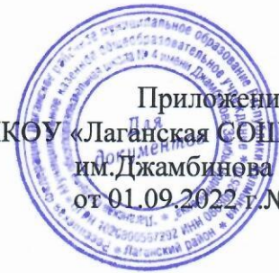
График приема пищи обучающимися и дежурства педагогических работников:

Приложение №1 к приказу МКОУ «Лаганская СОШ № 4 им.Джамбинова З.Э.» от 01.09.2022 г. № 229